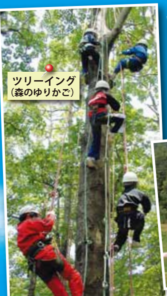
ツリーイング(森のゆりかご)