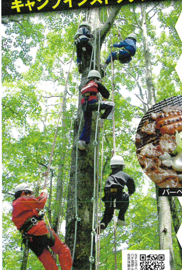
ツリーイング(木のぼり)