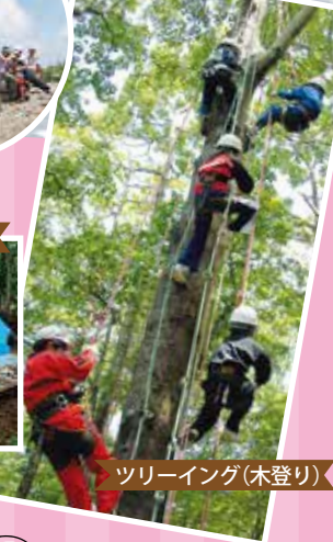
ツリーイング(木登り)