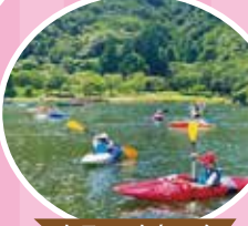
カヌー・カヤック